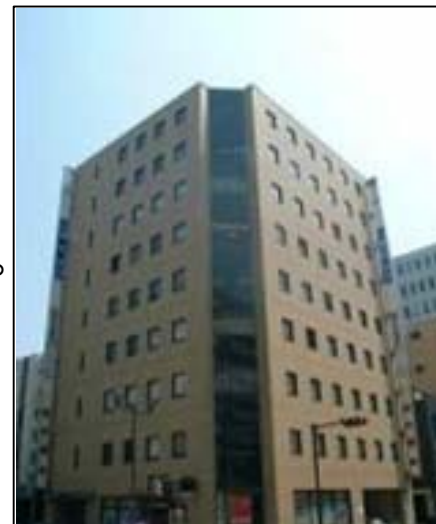
関内営業センターは、横浜市営地下鉄①番出入口隣の朝日生命横浜関内ビル6階にございます。 お気軽にお立ち寄りくださいませ。

関内営業センターでは地域密着を心がけ、 金沢区・磯子区・中区を重点地域として おります。その結果、 金沢区 で順調に営業 活動をさせていただいており、これも、皆様 からたくさんのご相談をいただいている結果 だと感謝しております。